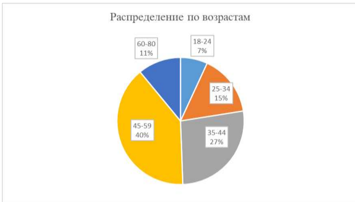
Рис. 2 – Возрастной состав участников тестирования

Максимальное количество прошедших тестирование пришлось на возраст от 45 до 59 лет (4573 человека или 39,6 %). И у этого возраста самый высокий показатель по общему индексу финансовой грамотности – 16,41 балла, в том числе по индексу «Знания» (7,26) и индексу «Навыки» (5,64). По индексу «Установки» люди в возрасте от 45 до 59 лет набрали 3,51 балла выше чем у молодежи 3,28